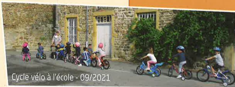
Cycle vélo à l'école - 09/2021