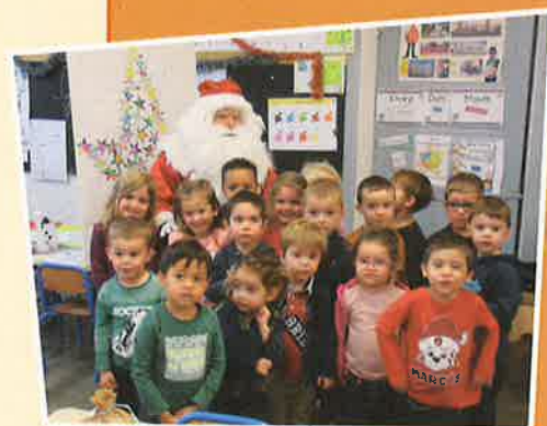
Le Père Noël à l'école - 12/2021

https://ogec42470.wixsite.com/notredame42470