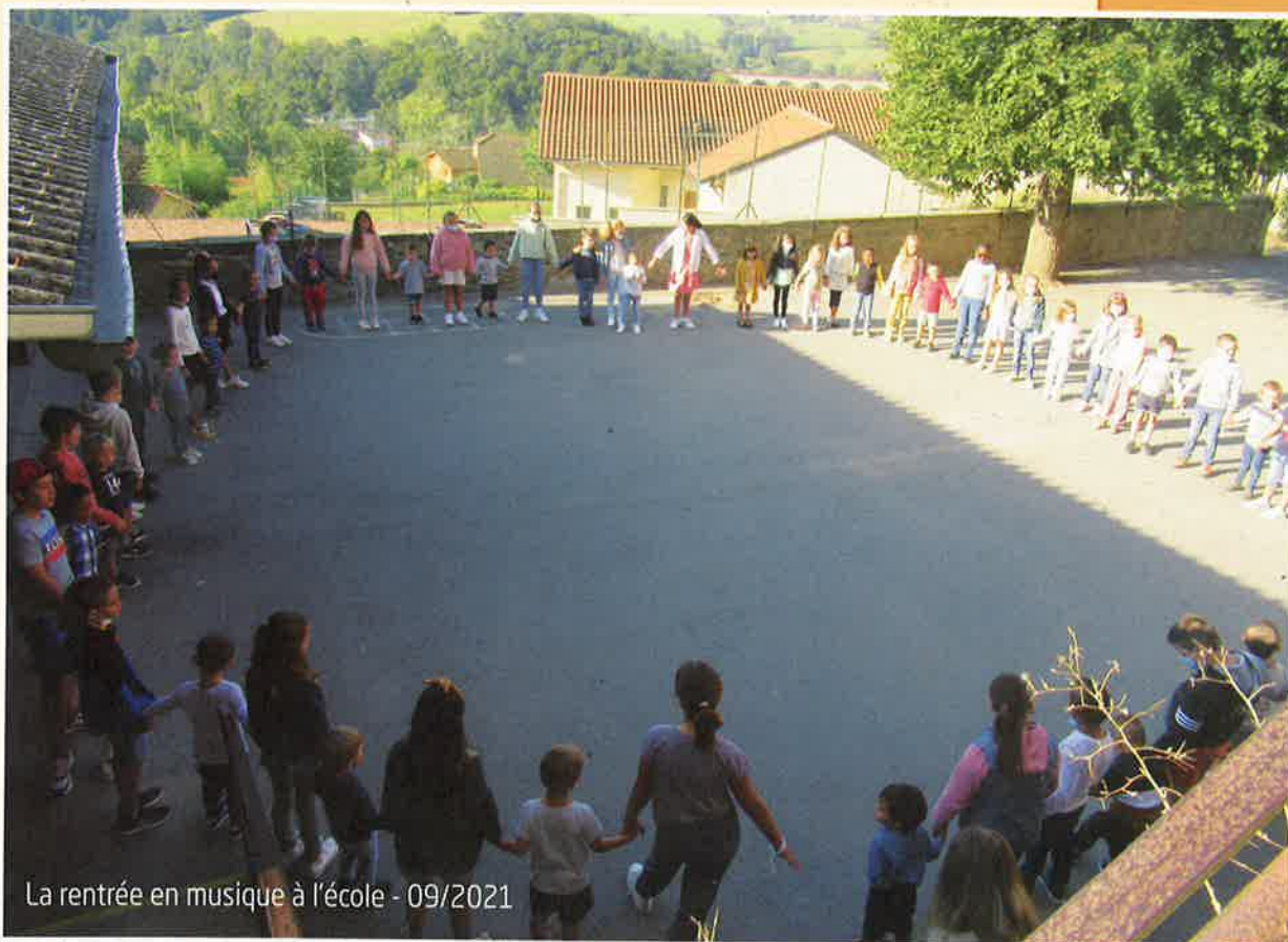
La rentrée en musique à l'école - 09/2021